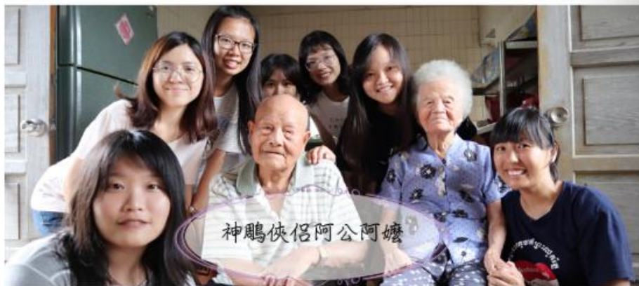
神鷲俠侶阿公阿嬤