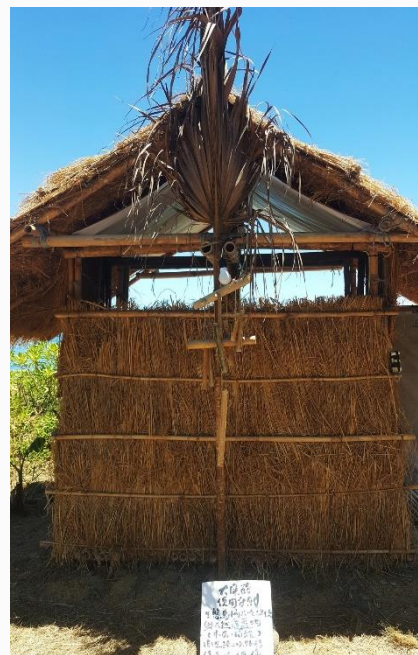
陽光三葉草生態村的自然建築計畫