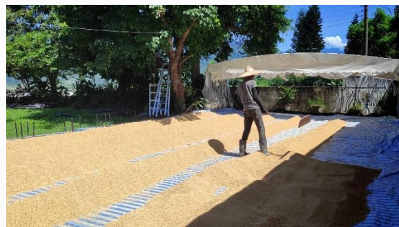
陽光三葉草生態村曬米日常