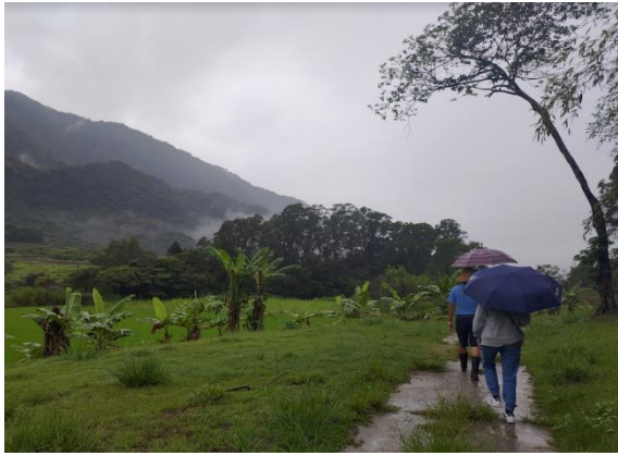
與理事長一起走在雲霧繚繞的竹林步道