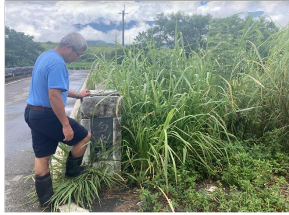
理事長介紹羅山社區白水橋的由來