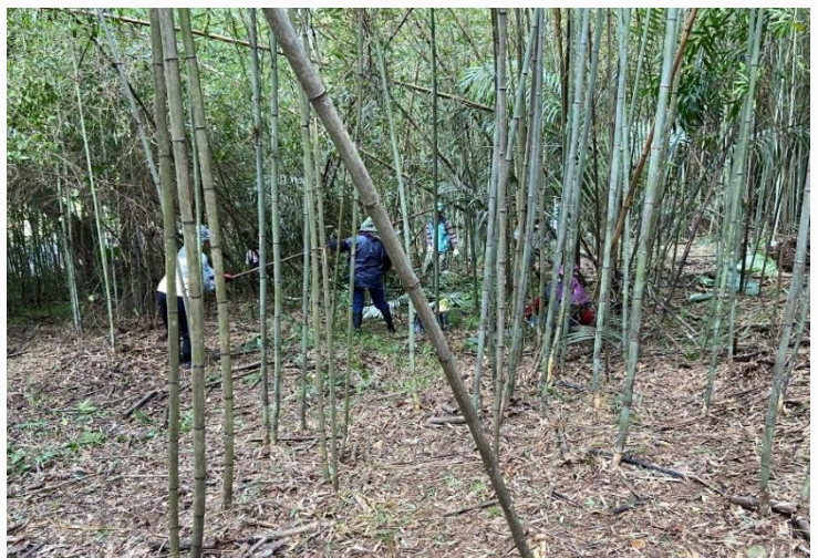
當時社區居民同心協力，疏伐竹林、重整環境