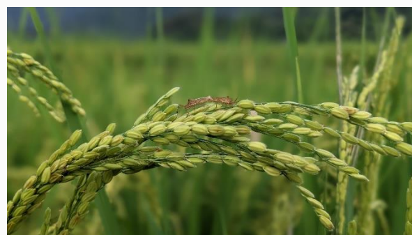
陽光三葉草生態村的稻子