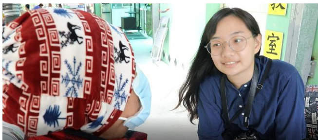
專心聆聽長輩的故事。