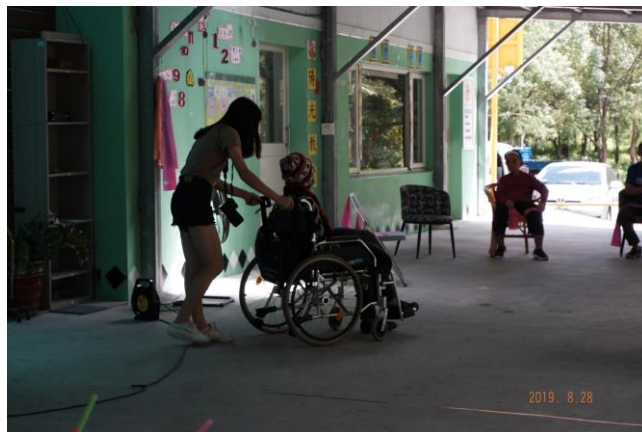
帶行動不方便的長輩到戶外散步。