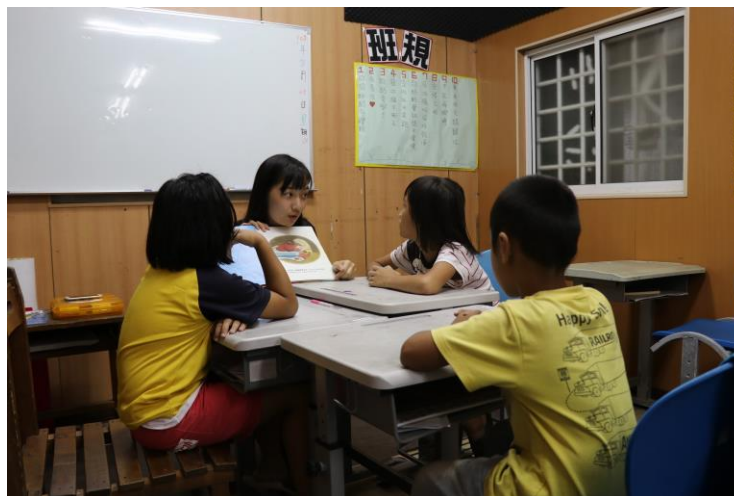
和小朋友一起念故事書：《圖書館老鼠》。