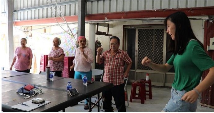
帶著長輩一起做健身操，活絡筋骨。