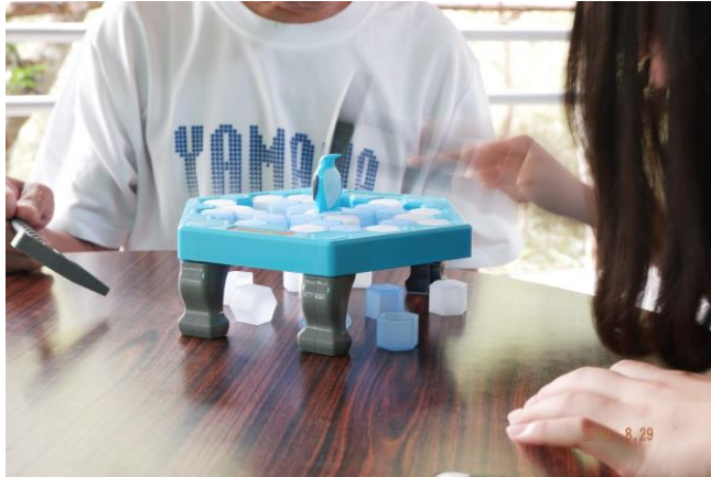
陪伴個案玩桌遊，藉著遊戲，讓個案多思考，也活動手部肌肉。