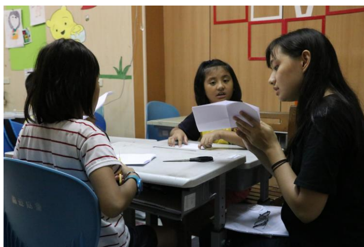
念完故事書並講解書籍含意之後，帶入實作：製作自己的小書。