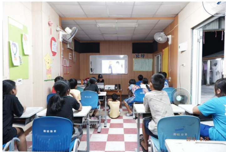
孩子們專心在看老師的教學影片。