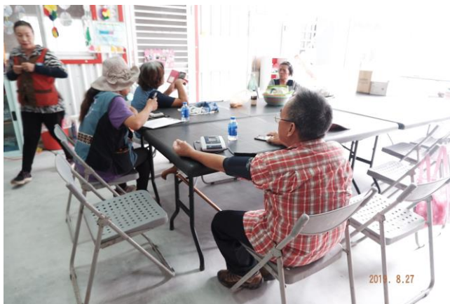
幫助長輩測量血壓。