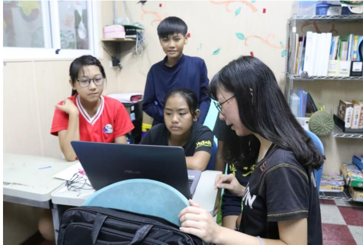
影片剪輯實作教學。