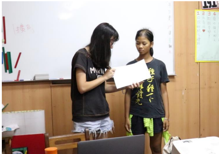
同學上台分享自己的分鏡表練習。