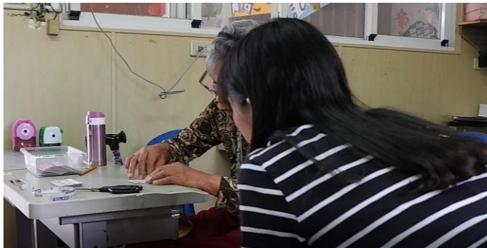
教長輩製作當日課程的勞作（用撲克牌做成的窗簾）