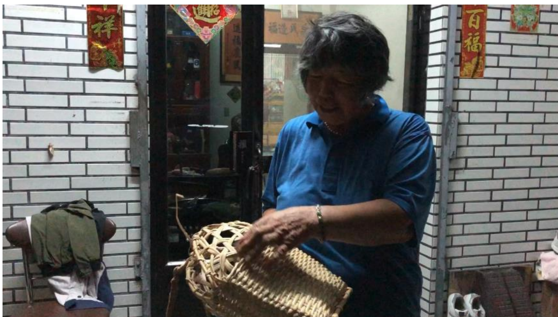
ma mu (阿美語阿嬤之意) 向我們展示她編織的黃藤背包。

IV. 黃藤背包：是我們到當地後，發現利用竹子製作盒子難度實在太高，但之後發現他們的黃騰工藝非常純熟及精巧，因此想改為盛裝的容器，沒想到還是無法，因為編織一個耗時兩個月，價值太昂貴，不好意思向他們索取。