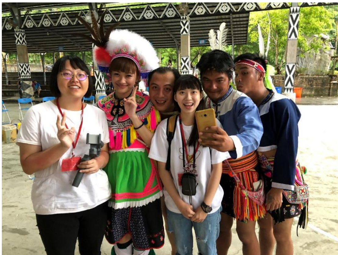
與身著當地傳統服飾的族人們合照。