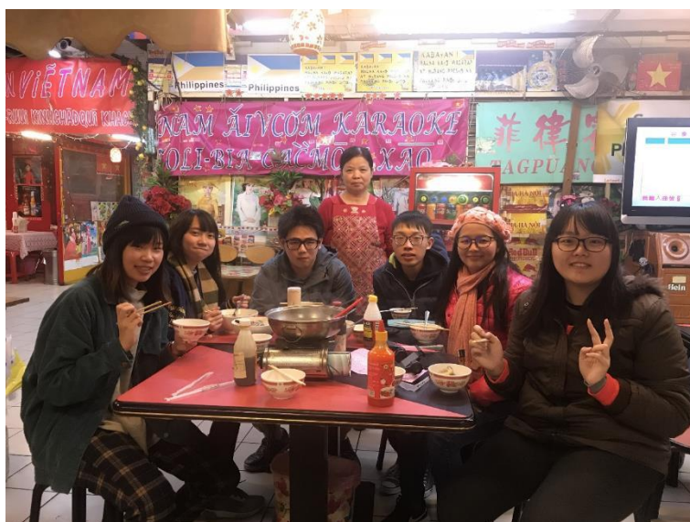
在第一廣場的拍攝作業。

以及公視 2018 年感動 99 的影像紀錄營，在大多數組別都拍攝劇情片的狀況下，我們依然挑選了比較具議題性的紀錄片，拍攝第一廣場一些為了移工設立的攤販，帶出移工的議題。