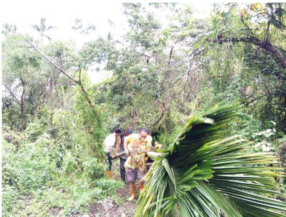
早晨前往山上砍檳榔樹。

其他的準備工作還包括了砍竹子、以及搭建指揮所、做竹杯。莫言老師本說一早清晨便前往山中砍竹子，但到了才發現，實際砍的是檳榔樹，因為檳榔相較竹子較為堅固，比較適合搭建瞭望台；而指揮所因為有棚子，最後使用檳榔樹來裝飾，非常美麗以及符合部落特色。做竹杯的年紀大都比較小，屬於國高中，竹杯的意義在於豐年祭時會被當成公杯飲酒，讓年紀小的人跟著部落去做可以在身體力行中感受文化、傳承文化。