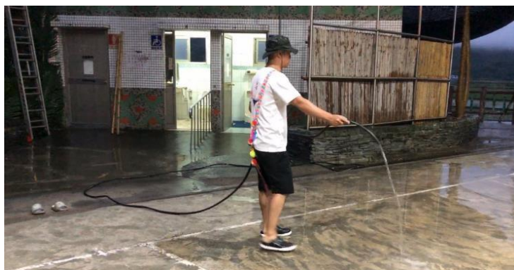
豐年祭開始前的打掃準備工作。