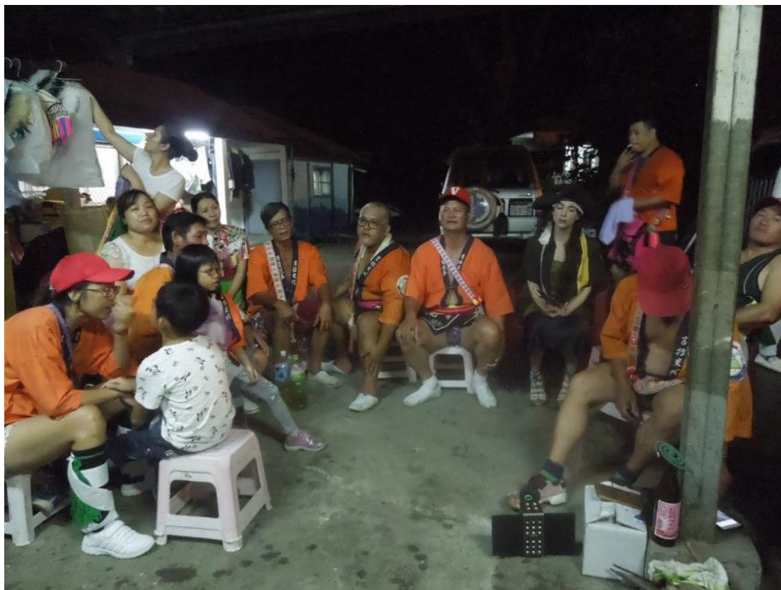
拉讀故事的橘色日式風格制服。

豐年祭除了正式的舞蹈之外，到了晚上也會有餘興節目，他們會各自穿上印有所屬階級名字的T恤上場舞動。主持人一一叫出各個階級的名字，此時被叫出的階級就必須來到跳舞場中間為大家表演準備好的橋段，頭目、村長和部落中重要的耆老亦會在舞場中間欣賞表演。這個餘興表演是由階級內自己討論與練習，自主參加，說是夜晚的餘興表演，在我們看來卻是一個讓階級內可以有更多相處，產生更多羈絆的機會。