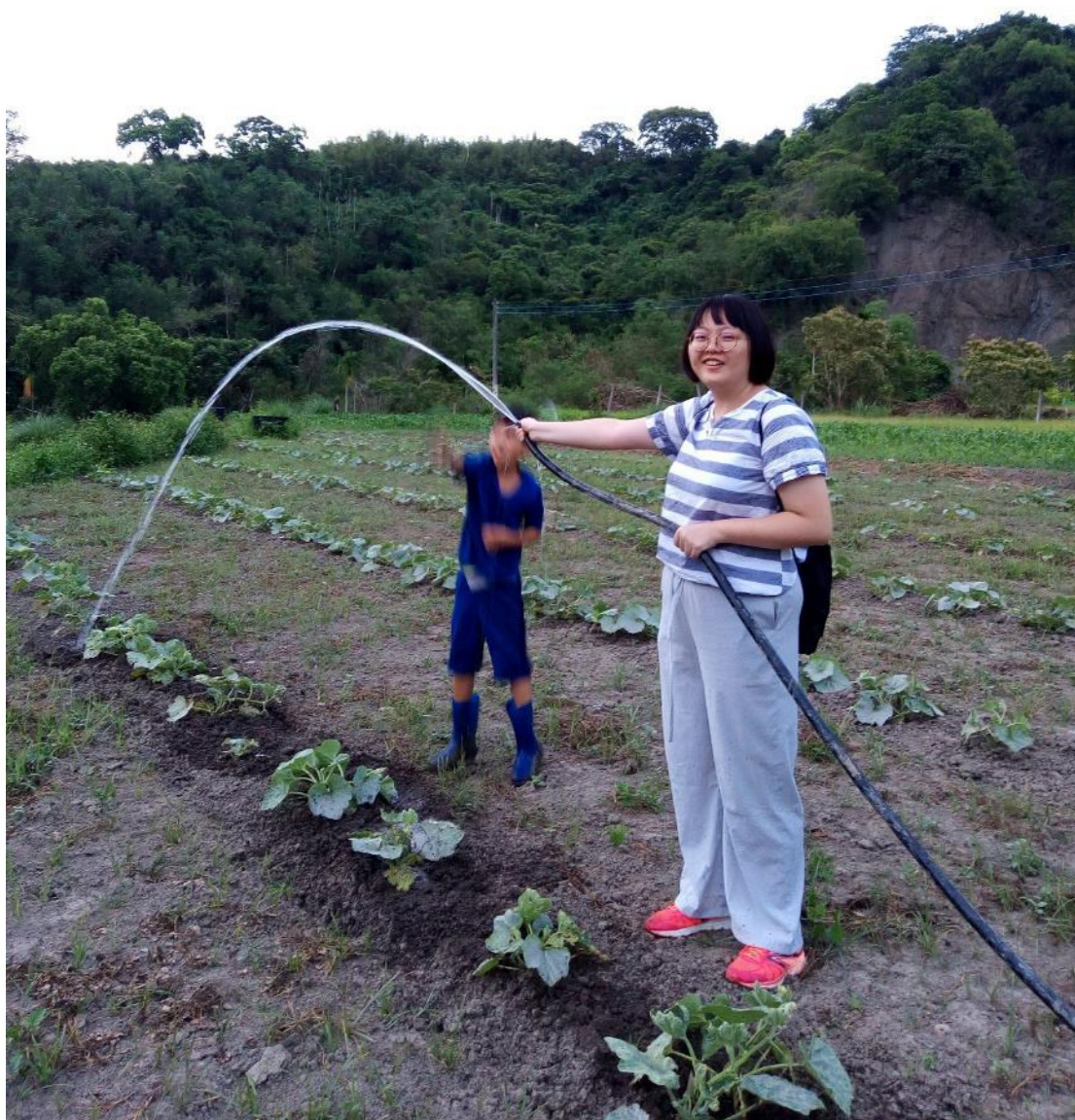
拜訪農場的我們體驗農忙。

IX. 小米酒：關於小米酒，是在阿土大哥帶我們上山的那段時間決定列為見面禮之一的，一下車，女主人便熱情的招待我們，替我們倒入她自