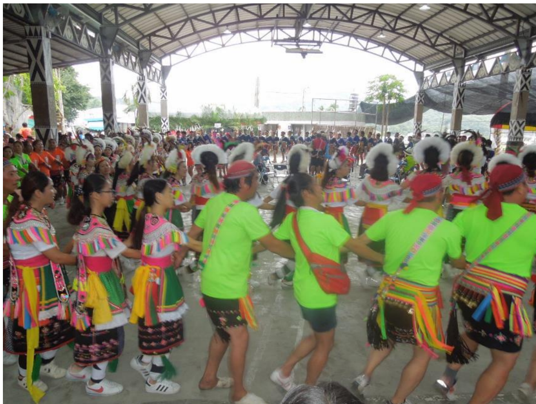
跳舞時他們會穿著傳統的正式服裝。