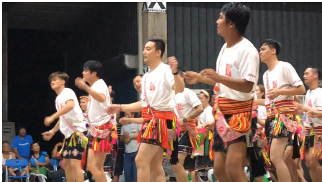
白色的拉辛並，這次與我們經常接觸。