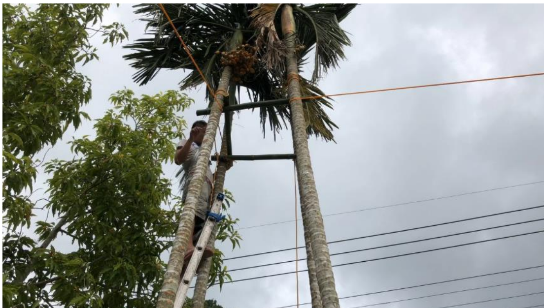
利用檳榔樹搭建指揮台。