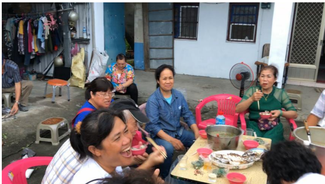
與百家利一同享用 pa ke lang 吃魚的儀式。

而今年，在 pa ke lang 之後，活動並沒有結束，前往舞場後，發現他們在進行殺豬的儀式。這個儀式由帶刀的主持，許久沒殺豬的他們決定用這一餐慰勞底下階級的人，除了讓弟弟不要這麼累，也是讓他們慶豐收，代表他們今年卸下刀，一個結束的開始，給他們很豐盛的一餐，其實不一定要殺豬，只是剛好今年交接，象徵讓他們有力的上來，不要太辛苦。