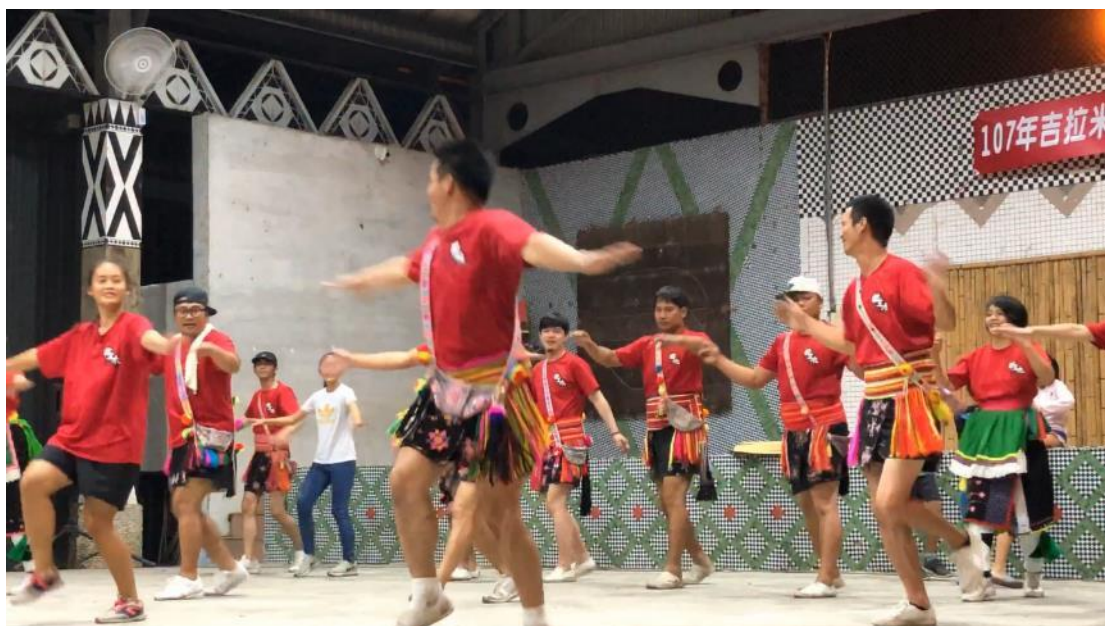
紅色的拉主木，擔任這次的帶刀階級。