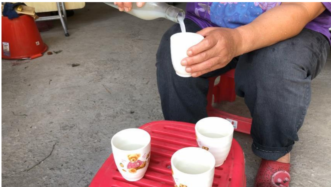
女主人親自為我們倒出招待的小米酒。

已製作的小米酒，與其說是米酒，她說，現在已改為米露，米露的酒精低，喝起來也較為順口，非常受歡迎。