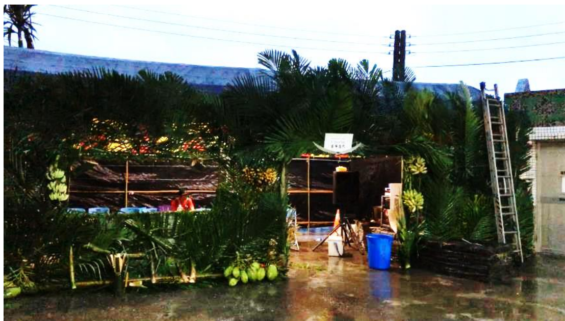
檳榔樹裝飾的指揮所。