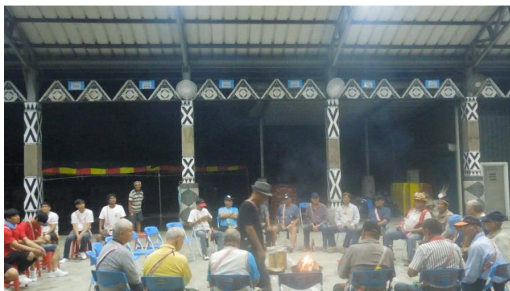
ku mu lis 儀式

至於晚上，則有一個 ku mu lis 的儀式，會去抓魚蝦在跳舞場煮食，幾個比較重要的頭目、主席和耆老會圍成圈一起吃飯、吟唱、討論一些重要的事，這個儀式女生不能參與，因此我們必須把攝影機架在場外去做紀錄，並且不能跨入他們的場域之內。