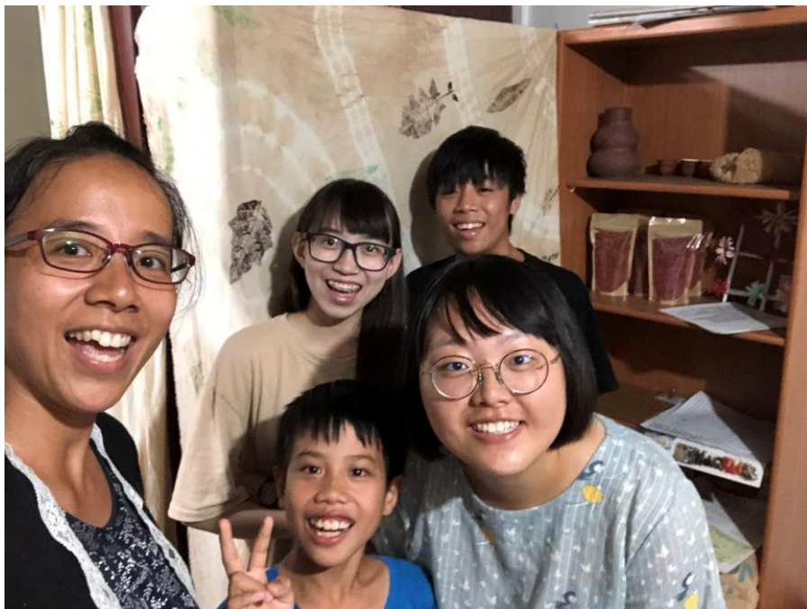
最後面的男孩，和我們一樣，是即將離開部落的人。

在不算短的服務生涯裡，是深刻的體驗到這點，但不管每次如何把這樣的想法放在腦子裡，心裡總還是認為，我來到這個地方，就算只有一點點也好，我是真的，想為這個地方帶來一點點的不一樣。