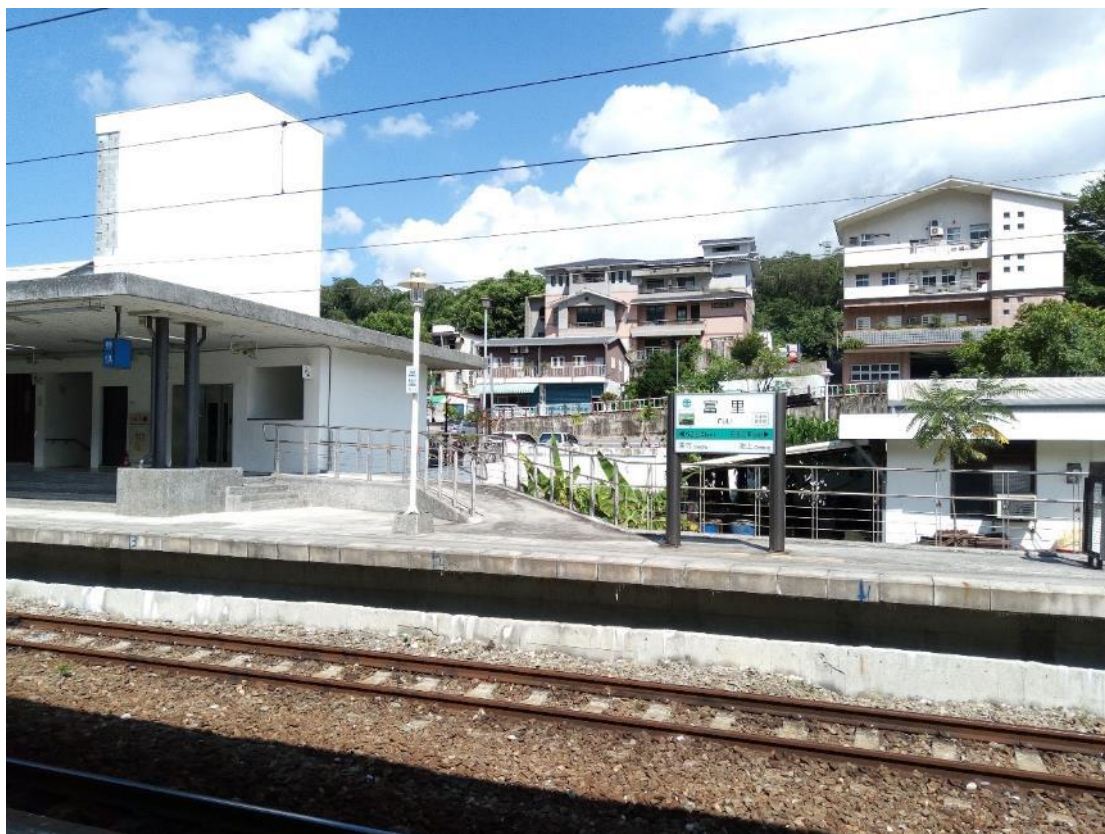
將近八小時的車程，終映入眼簾的富里火車站。

早在小大一時，因為蹲點台灣有前來課堂上與我們作分享，那時候便埋下想參加這個活動的種子，不過想歸想，並沒有實際付出行動，一直到後來這個大三的暑假，才投出報名表。