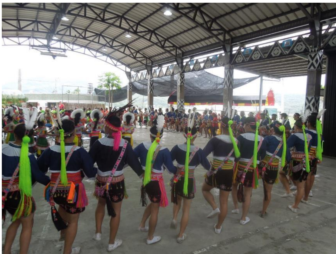
帶刀的傳統服飾正面照以及背面照。