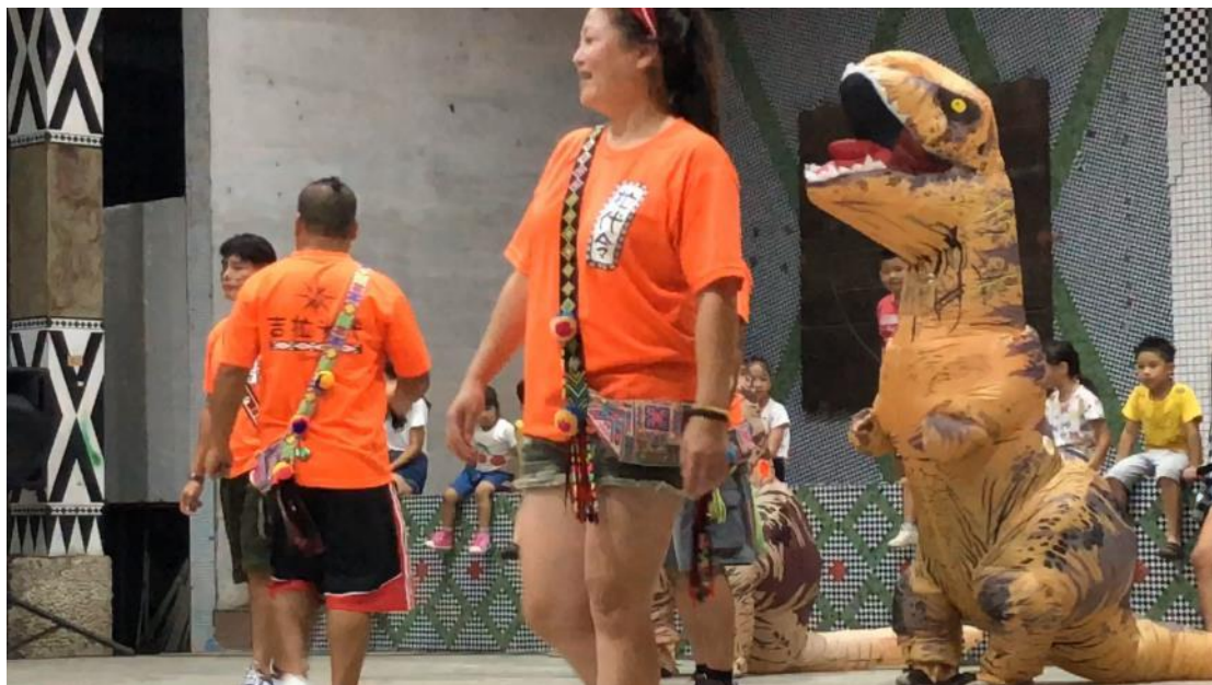
橘色的拉代令，拉代令在阿美族語中有警察、管理階層的意思。