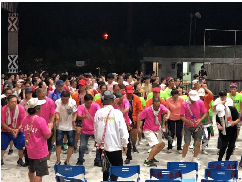
五顏六色的跳舞場，繽紛了我的八月。