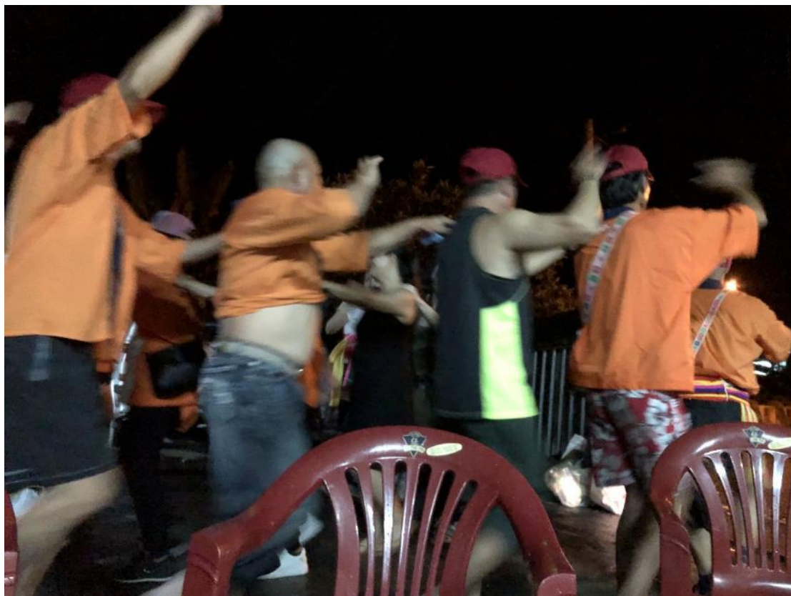
拉讀故事餘興節目彩排。

這樣的階級不只侷限在舞場之中，也延續到了舞場之下的餐桌上。迎賓宴的那天，餐桌一個接著一個的被立起，可以看到階級較小的會負責擺飾的動作，而稍高一點的階級時而使喚，時而動作，至於再高的階級則是專職監督的工作，再次體認到階級在吉拉米代的重要規則性。