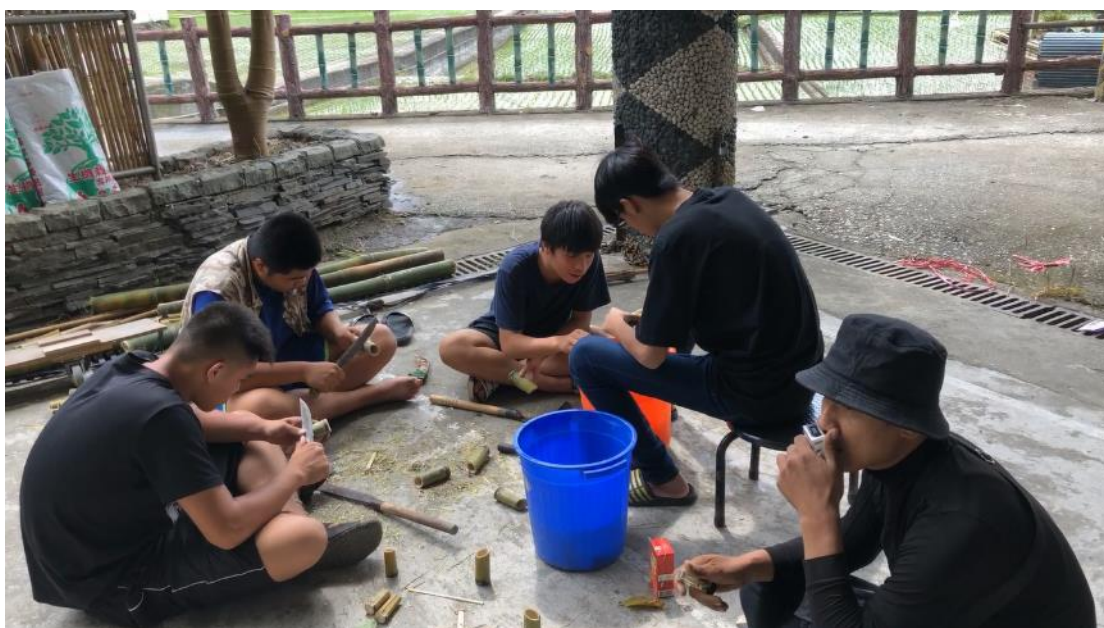
年紀較小的族人一起製作竹杯。