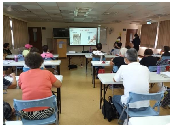
人工輔具功能介紹及回答長輩問題