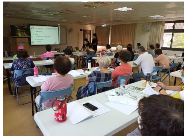
介紹跌倒傷害及簡易肌力訓練示範教學