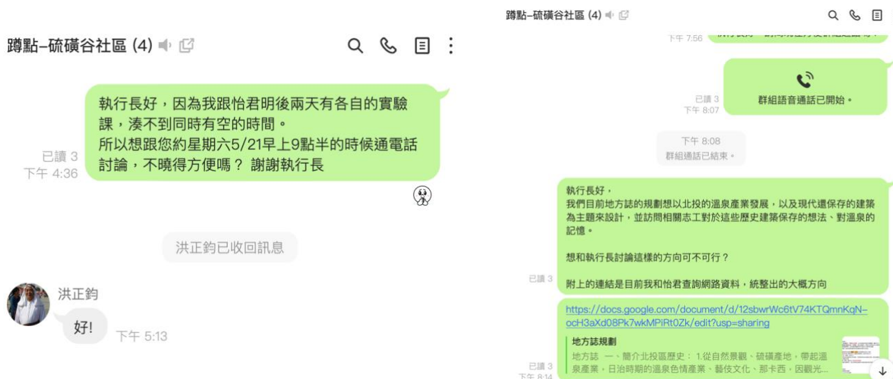
線上通話紀錄及訪網確認

多次與執行長線上通話，將我們網路上查詢的資料與執行長討論，了解北投歷史人文故事、豐年里社區特色等。