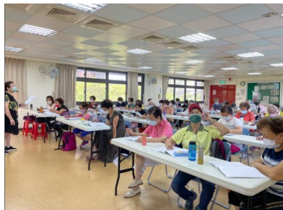
實際觀察據點上課情形 (左圖：8/23 廣場舞課 右圖：8/26 歌唱課)