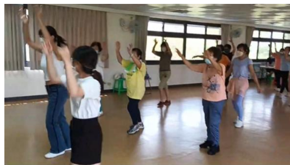
課程教學、拆解舞蹈動作