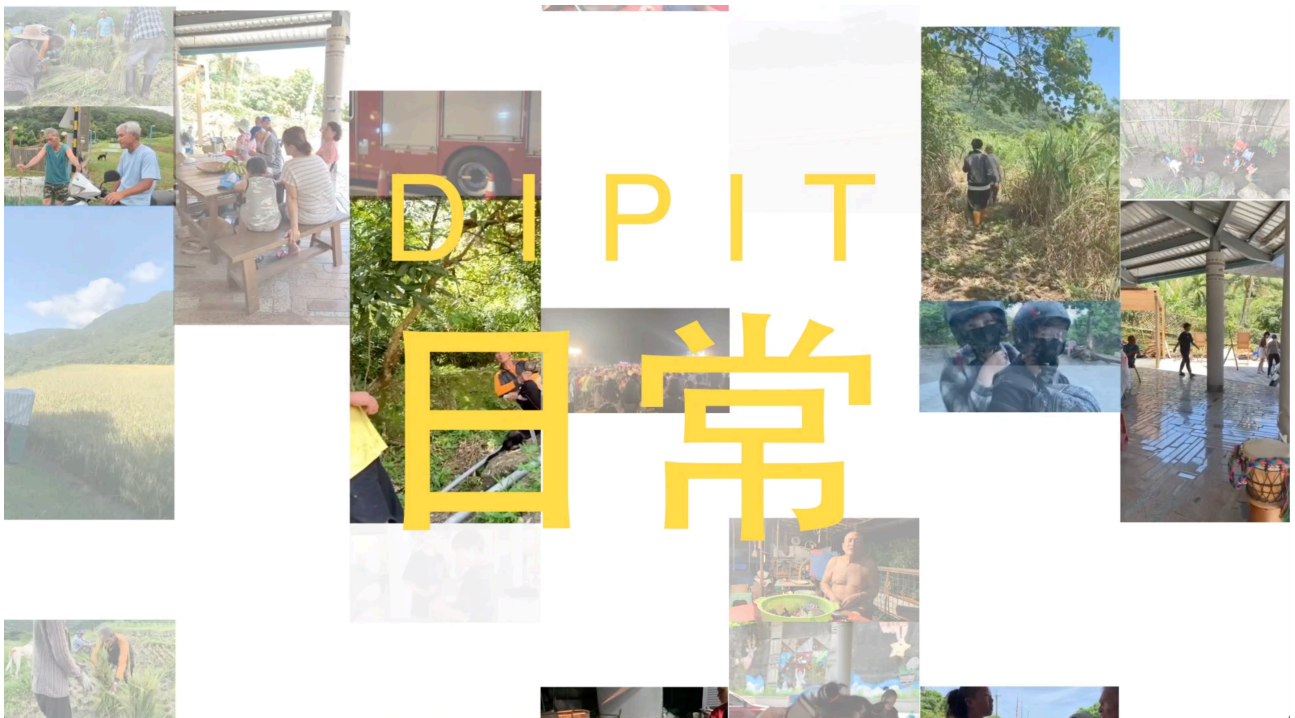
回顧影片於創意成果獎中展示

15天的旅程就像是一場夢，而阿公阿嬤們的記性沒有很好，留住快樂的方法有很多，而我們選擇我們最拿手的方式，用影像將這些快樂保存，在最後一天離別之際，我們辦了一個小型的離別會，事先將割稻的各種照片洗出來，且剪了一隻小短片，在最後一一呈現給阿公阿嬤，而影像也留給聯絡人，他們也在2019年8月4日復興節公開放映，讓參與的不管是遊客，還是長者們的子孫，更加的瞭解這塊土地的運作，那些影像都是我們的共同回憶。