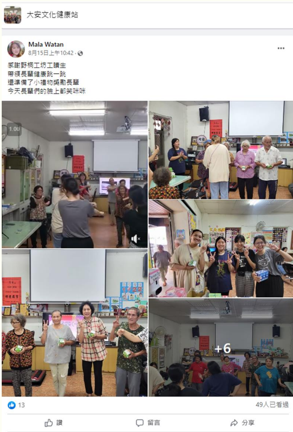
大安文健站衛教當天貼文

透過正確用藥的課程知識分享，以及課堂中的實際演練，長輩們對於用藥方面有了進一步的認識及瞭解。並且，透過機能舞蹈帶動跳的課程，讓長輩們活動筋骨並且保持心情的愉悅。