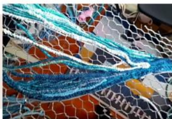
製作展品 i n g

作品的每一個配色和安排的走向都會影響整體美感，每次下針前總是不斷調整，無時無刻考驗著我們。縫製過程中縫線針頭不時會扎到自己手，作品的網格也把我們的手臂刮花了，但看著棉線透過來回穿梭、拉緊的過程漸漸勾勒出海水的流動感，隨著完成面積擴大，成就感也油然而生。