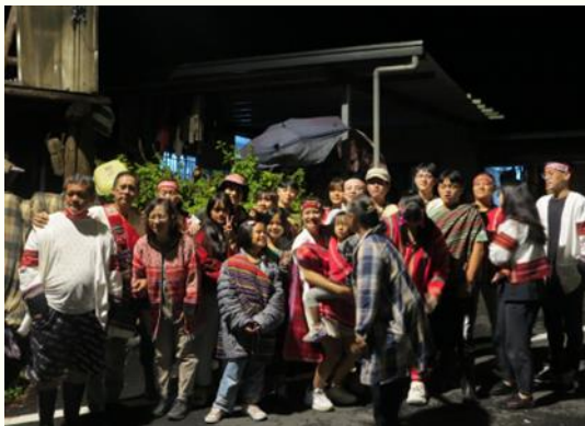
族人穿著族服參與祖靈祭

https://drive.google.com/drive/u/0/folders/1DuHj927Uv35yX6yN4GuV9IUpGcGYgel1