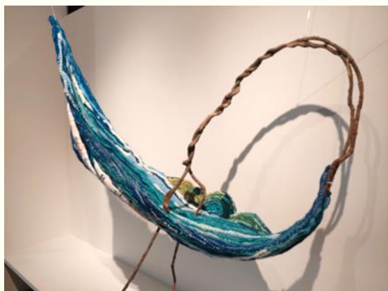
「聽說...但是」- 逆寫歷史

目前作品展覽於位於台中大里的纖維工藝博物館，作品名稱為：「聽說...但是」- 逆寫歷史。旨在探討外來勢力到來後對於原住民族的族群遷移造成的影響，藉由此項作品，期望帶給觀展民眾對於歷史能有不同的認知及思考。