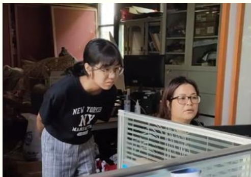
討論影片剪輯方式