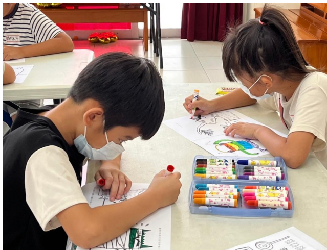
彩繪《彩色怪獸》附錄的圖畫紙