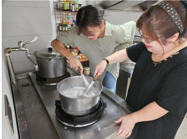
將芋泥、牛奶、玉米澱粉攪拌煮沸