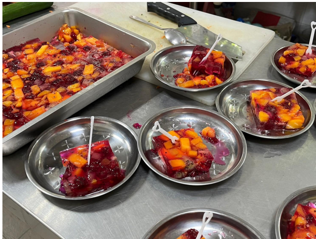
將水果果凍切塊裝入盤中