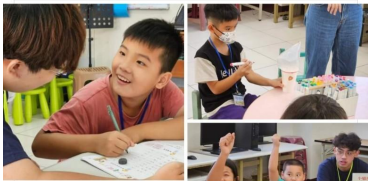
教會的粉絲專頁分享

2023蹲點·台灣·路上歷險記——在 路上基督長老教會。 8月7日 · 0 《路上歷險記EP15》 | 陪讀班 | 📖 「我們家裡只有我一個小孩，爸爸、... 查看更多