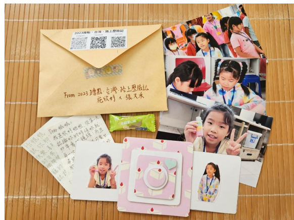
送給孩子們卡片和照片