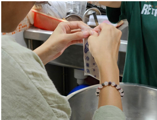
將芋仔冰液體倒入冰棒袋中