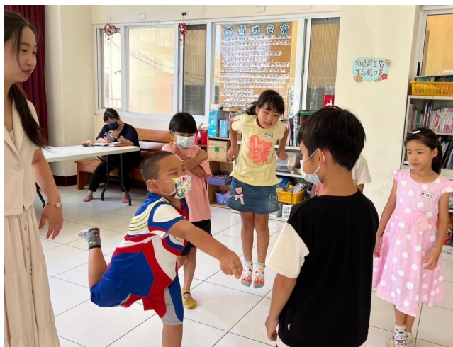
「誰是天使」暖身活動