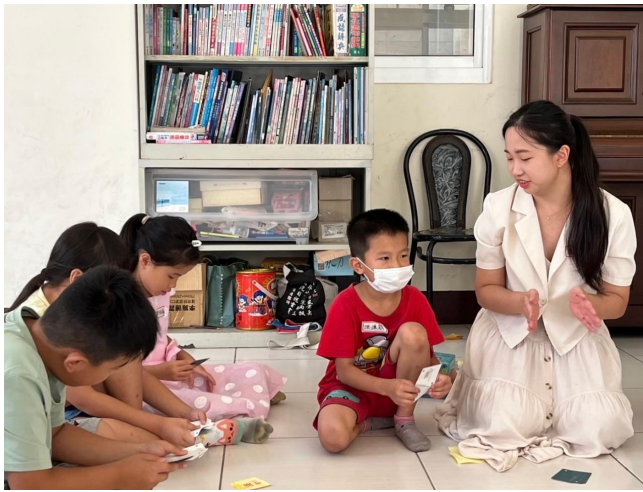
孩子們向大家分享自己嚮往的職業