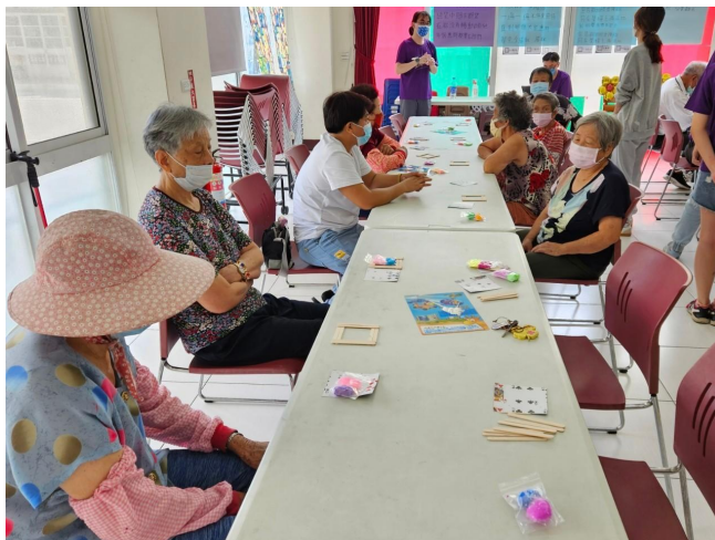
發放手作相框材料