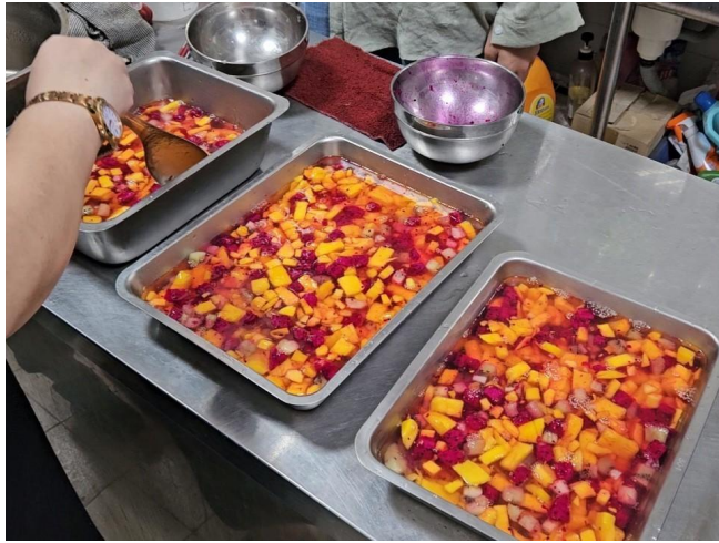
將洋菜粉液體倒入裝有水果丁的鐵盤中