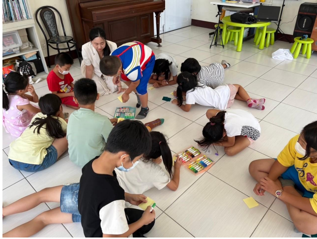
孩子們在便利貼上寫上三個自己嚮往的職業