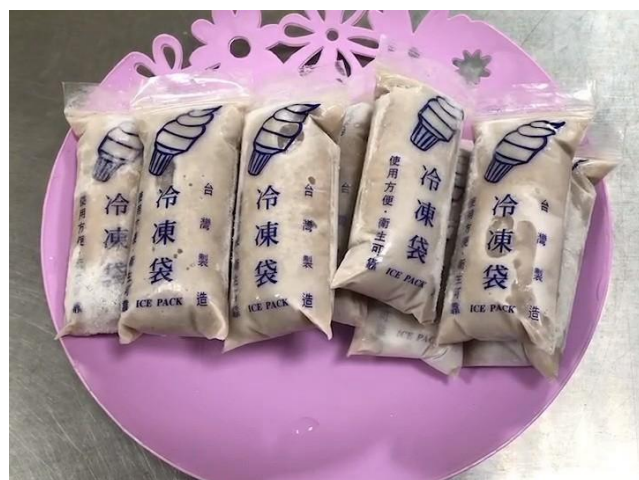
將芋仔冰讓入冷凍庫冷藏