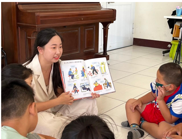
導讀《大人上班都在做什麼?》