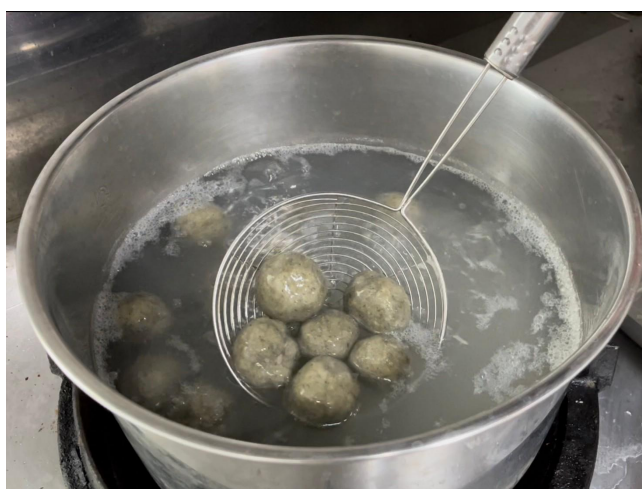
將草仔粿湯圓放入鍋中煮熟撈出