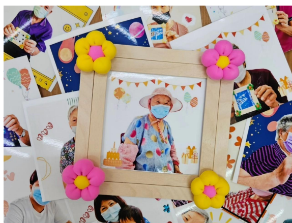
將長輩照片放入相框的成品照