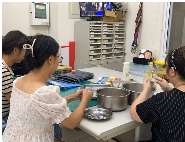
將芋泥包進草仔粿麵糰內