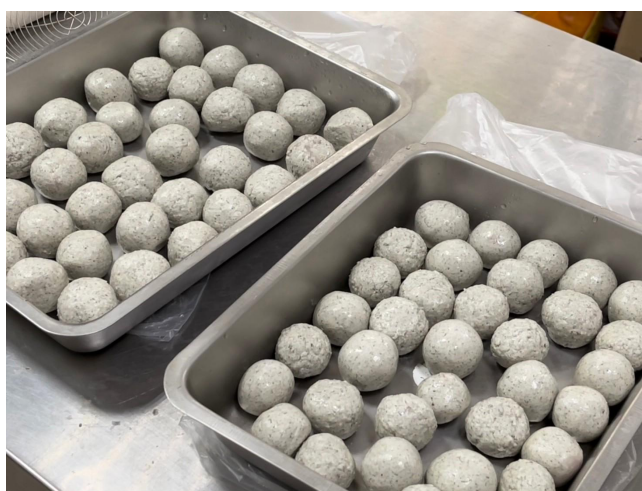
將包好的草仔粿湯圓放入冷凍庫