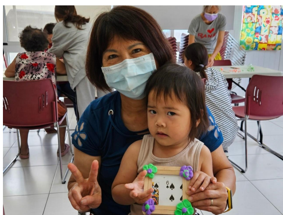
長輩創作扁扁的花瓣造型