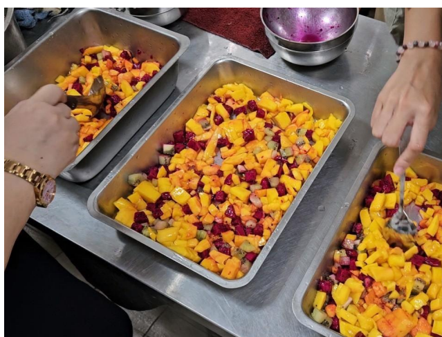
將水果放入鐵盤中鋪平