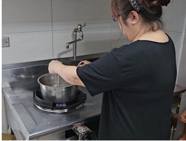
將洋菜粉倒入鍋中煮沸