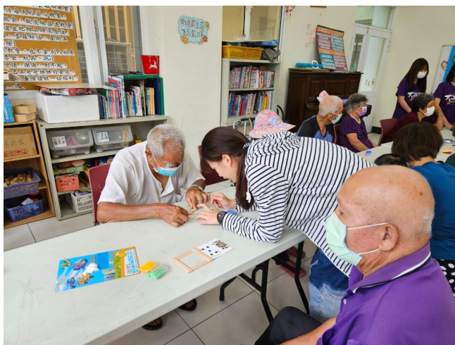
到各桌教學、協助長輩製作