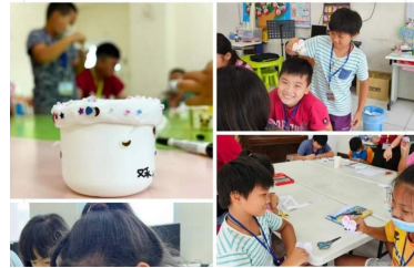
教會的粉絲專頁分享

2023蹲點·台灣·路上歷險記——在 路上基督長老教會。 8月8日 · 0 《路上歷險記EP17》 | 再次啟程 | 📺 在杜蘇芮颱風離開之後，我們再次踏... 查看更多